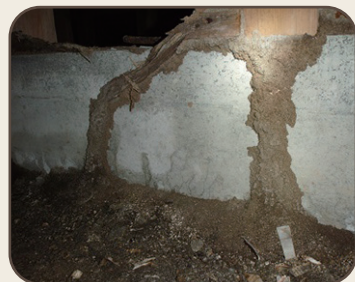
床下のシロアリ被害