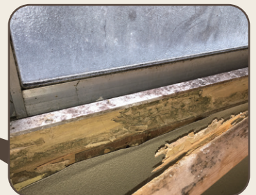
窓枠のシロアリ被害