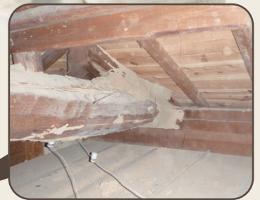
天井裏のシロアリ被害