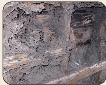
内壁のシロアリの被害